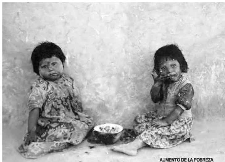
AUMENTO DE LA POBREZA