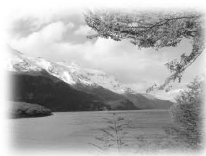
LAGUNA DEL DESIERTO

La Concertación llegó al poder el 11 de Marzo de 1990 con el presidente Aylwin, los sucesores fueron: Eduardo Frei, Ricardo Lagos y Michelle Bachelet quién entregó el gobierno a Sebastián Piñera candidato de la Centro Derecha, poniendo fin a la era de la Concertación el 11 de Marzo de 2010