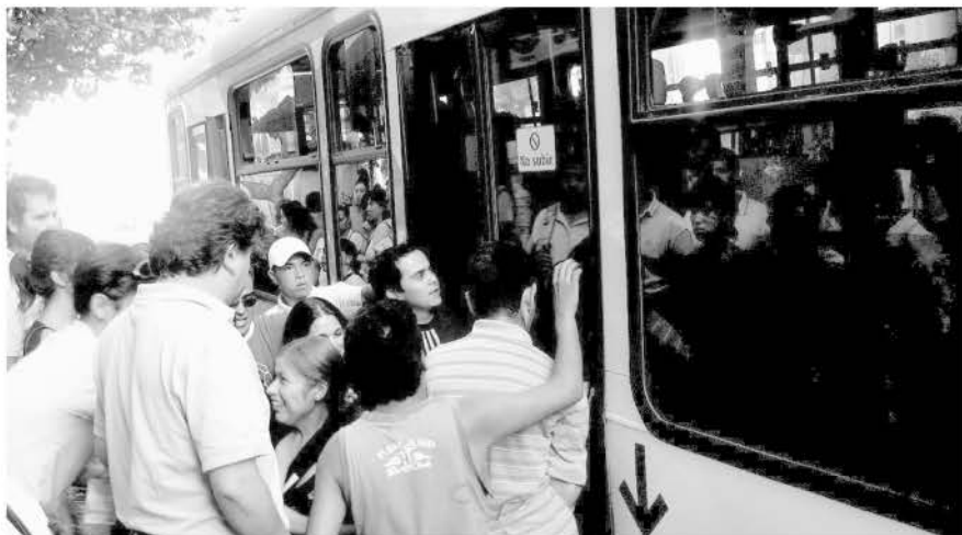
CAOS EN EL TRANSANTIAGO

Durante el gobierno de la presidenta Bachelet el número de las personas más pobres creció en 355 mil habitantes, dejando en evidencia la ineficacia de la red social con la que justificaba el sentido de su gobierno, produciéndose el primer aumento del índice de la pobreza en el país en 23 años.